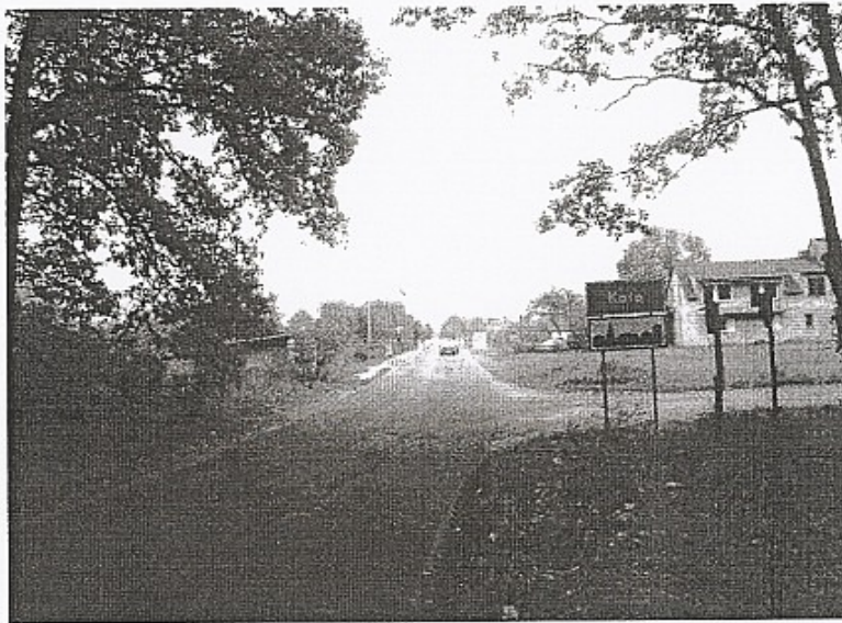
Widok miejscowości od strony zachodniej

Mieszkańcy Koła wykazują duże zainteresowanie sprawami społeczności lokalnej. Dzięki ogromnej aktywności i zaangażowaniu Ochotniczej Straży Pożarnej udało się wyremontować budynek oraz część pomieszczeń remizy. Mieszkańcy dokonali tego własnymi siłami, wspólnie ze strażą, wykorzystując także udzieloną pomoc finansową ze strony Gminy Sulejów.